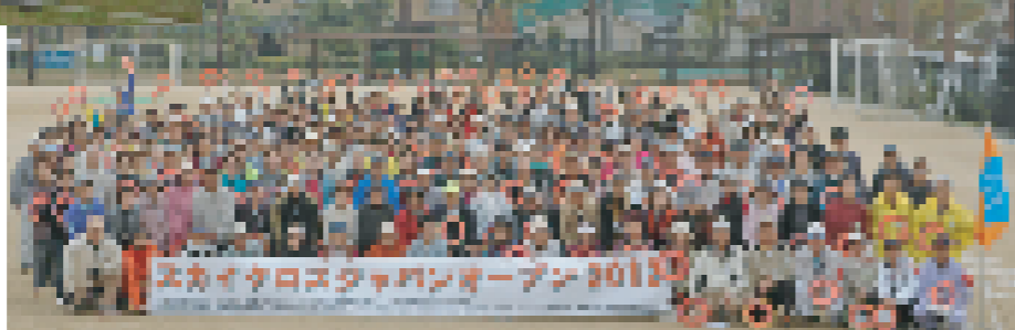
京都市・岩倉東公園グラウンドで 記念写真する参加者 (昨年のジャパンオープンより)