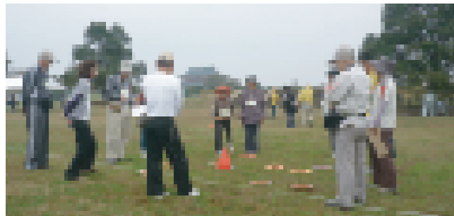
本大会会場、平城宮跡で 試合をする選手達 (一昨年のジャパンオープンより)